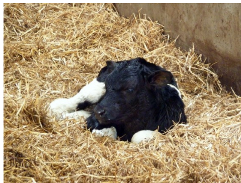
Varmebehandlet råmælk og sødmælk giver en god start for kalven, hvis det håndteres korrekt.

Varmebehandling af mælk til kalve foregår på flere besætninger, og kravene til råmælk og sødmælk er forskellige. Generelt giver højere varme bedre bakteriedrab, men også mere nedbrydning af mælkens bestanddele og forringelser af